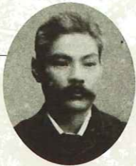
Yanosuke Iwasaki 1851~1908

우리나라의 해운업계의 근대화와 청량음료의 파이오니아 잉글랜드 출신. 1898년에 나가사키에서 위커상회를 설립. 일본 해운업에 큰 실적을 남겼으며, 이후에 일본 초기의 청량음료 메이커도 설립. 나가사키 외국인 거류지 실업계의 중심적 인물로서 활약했습니다. 대단한 친일가로 자신이 만든 상품에 반자(반자)이다. 반자(반자)인 레몬에이드라는 이름을 붙였을 정도입니다. 만년에는 캐나다에 이주하였으며, 아들의 위커·주니어에게 사업과 재산을 물려주었습니다. 부모와 자식 2대에 걸쳐 나가사키에 살았습니다. 「기린맥주의 전신을 설립」로버트·네일·위커의 형 윌슨 위커는, 글로버와 함께 「재팬부루워라 컴퍼니」를 설립. 이것이 현재의 기린맥주식회사의 전신이 되었습니다.