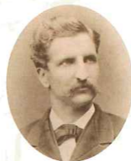
William Alt 1840~1905

프레드릭·링거 생애에 걸쳐 대외 무역에 종사. 메이지시대의 나가사키 경제계에 공헌. 잉글랜드 출신. 1864년경에 일본으로 건너와서 글로버 상회에 근무한 후, 1868년 영국인의 회사와 함께 흥링거상회를 설립. 거류지의 외국인과 함께 흥링거상회를 설립. 거류지의 외국인과 시민의 교류의 장소인 내외클럽을 설립하고, 나가사키의 상수도 건설, 우역, 대리점, 제차, 부분 발전 등 폭넓은 분야의 사업에 했습니다. 그가 1868년에 오우라 해안(나가사키)에 흥링거상회이던 행 나가사키지점 기념관(현)에 건설한 「나가사키 호텔」은 당시 아시아의 일류 호텔로서 명성이 자자했습니다.