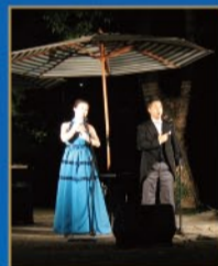
8月9日 リンガーベルコンサート

長崎を中心に活動を行っている音楽ユニット。1993年にはニューオリンズJAZZフェスティバルに招待され、同フェスティバルほか各地で演奏を行い好評を得る。