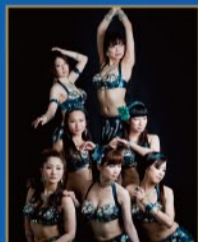
8月20日 Oriental Perfume

長崎を中心に情熱的なパフォーマンスを展開しているベリーダンスグループ。様々なライブ・イベントなどに出演。